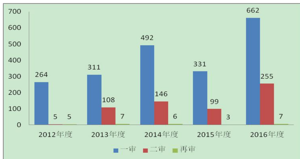
图 6： 2012-2016 年度一审、二审、再审案件数量折线图