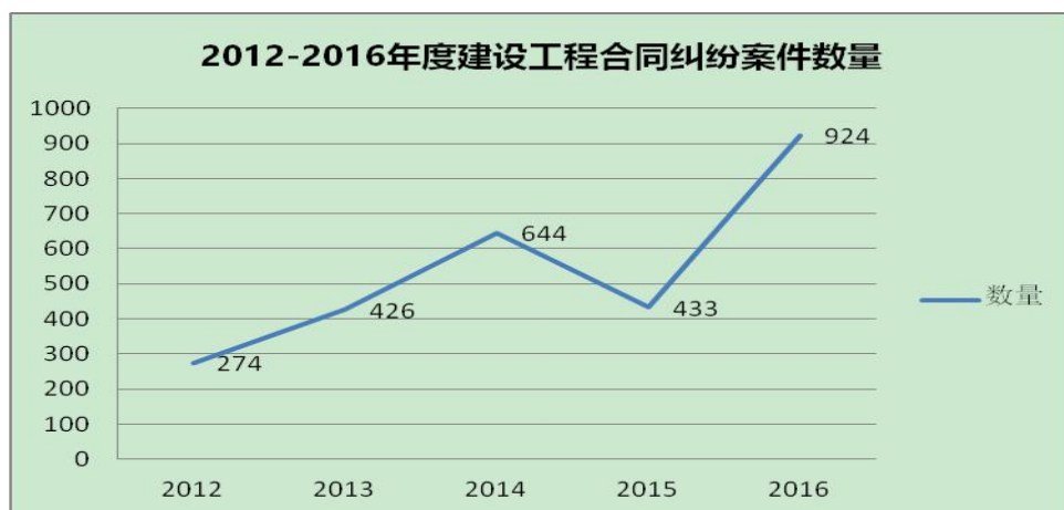
图 7：2012-2016 年度建设工程合同纠纷案件数量折线图

2. 一审结案数量大，所占比重高。从表 1、图 5、图 6 可以看出，从 2012 年至 2016 年 5 个年度中可以看出每年一审裁判类案例均占当年案例总数的 70% 以上且比较稳定，由此可知案件一审程序仍是法院