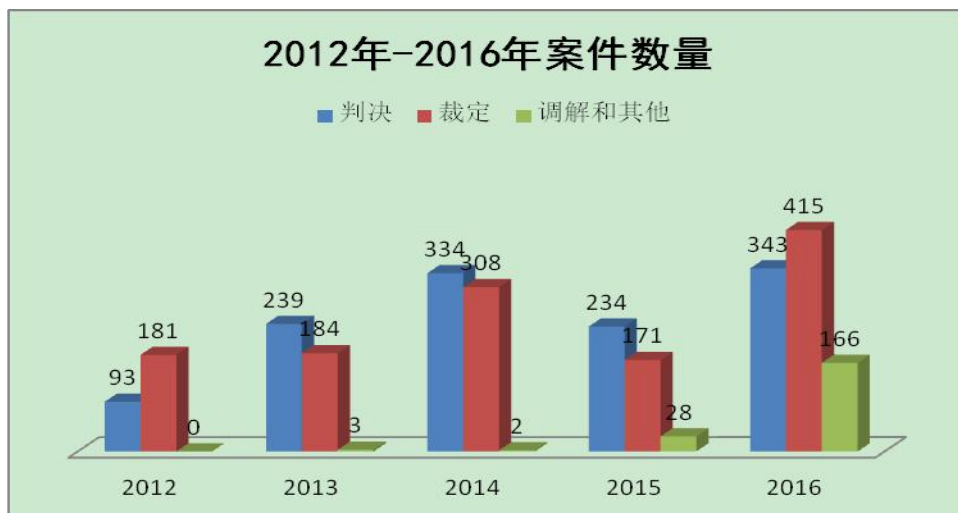
图 1： 2012-2016 年度建设工程合同纠纷案件数量柱状图

西安市中级人民法院及辖区各区县人民法院 2012 年至 2016 年建设工程合同纠纷案件，判决、裁定和调解等类型案例共计 2701 件。其中判决类 1243 件，裁定类 1259 件，调解和其他类 199 件。具体如下：