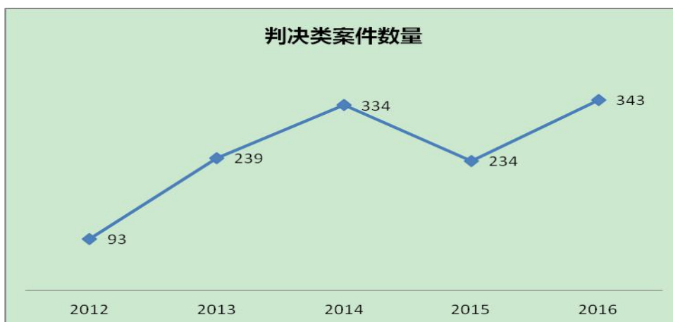
图 2： 2012-2016 年度建设工程合同纠纷判决类案件数量折线图

判决类案例共有 1243 件。其中 2012 年度 93 件，占当年同类案件数量的 33.94%；2013 年度 239 件，占当年案件数量的 56.10%；2014 年度 334 件，占当年案件数量的 51.86%；2015 年度 234 件，占当年案件数量的 54.04%；2016 年 338 件，占当年案件数量的 36.58%。