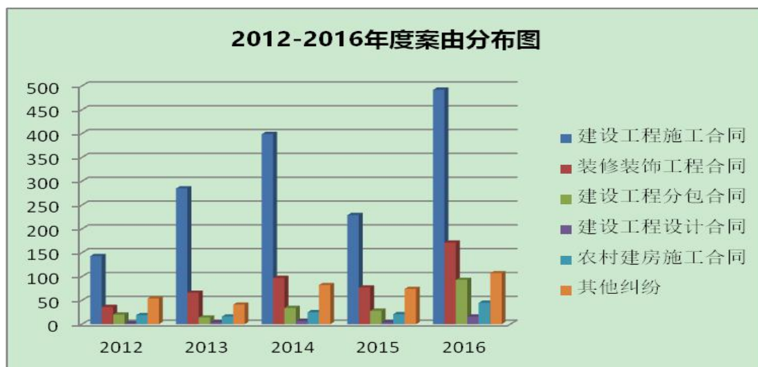
图 9：2012-2016 年度案由分布柱状图