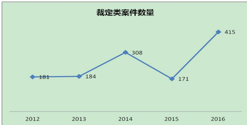
图 3：2012-2016 年度建设工程合同纠纷裁定类案件数量折线图

裁定类案例共有 1259 件。其中 2012 年度 181 件，占当年案件数量的 66.05%；2013 年度 184 件，占当年案件数量的 43.19%；2014 年度 308 件，占当年案件数量的 47.82%；2015 年度 171 件，占当年案件数量的 39.49%；2016 年 415 件，占当年案件数量的 44.91%。