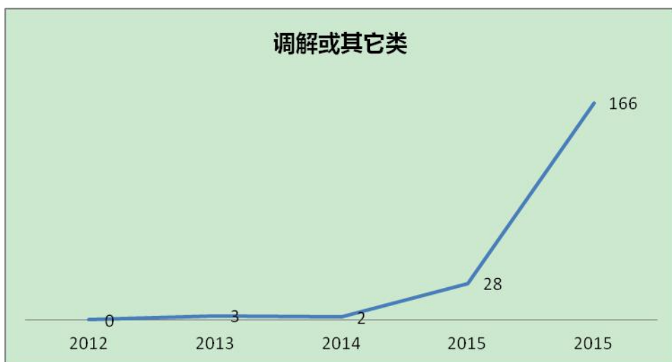
图 4：2012-2016 年度建设工程合同纠纷调解或其它类案件数量折线图

调解和其他类案例共 199 件，主要集中在 2015 年和 2016 年。其中 2013 年 3 件，2014 年 2 件，2015 年 28 件，2016 年 166 件。 ②